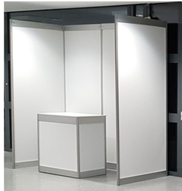
Messekoje mit Pult